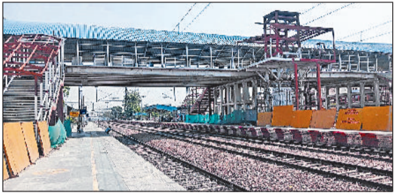
सोनीपत। स्टेशन पर तैयार किया गया नया फुट ओवरब्रिज।

दिल्ली रेल मंडल के अंतर्गत आने वाले सोनीपत स्टेशन पर बनाए जा रहे नए फुट ओवरब्रिज का निर्माण अंतिम चरण में है। फुट ओवरब्रिज पर गोलाकार के शेड व सीढ़ियां बनाने का काम पूरा हो चुका है, जल्द ही चारों प्लेटफार्म पर फुट ओवरब्रिज के साथ एकसीलेटर व लिफ्ट भी लगाई जाएगी। एकसीलेटर के लिए बेस तैयार कर लिए गए हैं, जबकि लिफ्ट लगाने के लिए पिलर लगाकर उन्हें इंटीरियर डिजाइन करवाया जा रहा है। साथ ही बिजली संबंधी कार्य भी एक साथ चल रहे हैं। उम्मीद है कि यात्रियों को रेलवे स्टेशन पर आने लाह नए फुट ओवरब्रिज की सौगात मिल सकती है। नए फुट ओवरब्रिज का निर्माण पूरा करने की जिम्मेदारी जालंधर की कंपनी को सौंपी गई है। प्रदेश में ए ग्रेड श्रेणी में शामिल सोनीपत स्टेशन पर