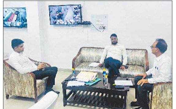
सोनीपत। अधिकारियों की बैठक लेते पर्यवेक्षक।