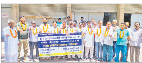
सोनीपत। यूनियन के नवनियुक्त पदाधिकारी शायत लेते हुए।