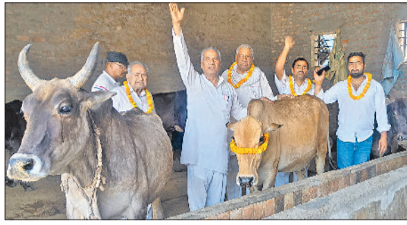
गोहाना। गावों का सम्मान प्रकट करते हुए नागरिक।

नंबरदार ने बताया कि वर्ष 2025 में सरकार की ओर से केवल तीन महोत्सव ही सहायता राशि के चेक मिले हैं, जिसके चलते गोशालाएं आर्थिक संकट से जूझ रही हैं और चारे की कमी बनी हुई है। संचालकों ने कहा कि वे स्थानीय नेताओं से भी मिले, लेकिन केवल आश्वासन ही मिला। उन्होंने सरकार से समय पर आर्थिक मदद देने की मांग उठाई, ताकि गोशालाओं का संचालन सुचारू रूप से हो सके।