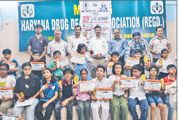
सोनीपत। केमिस्ट भवन में आयोजित पारितोषिक वितरण समारोह में जिला चैस एसोसिएशन एवं आयोजन समिति के पदाधिकारियों, अतिथियों के साथ मौजूद विजेता खिलाड़ी।