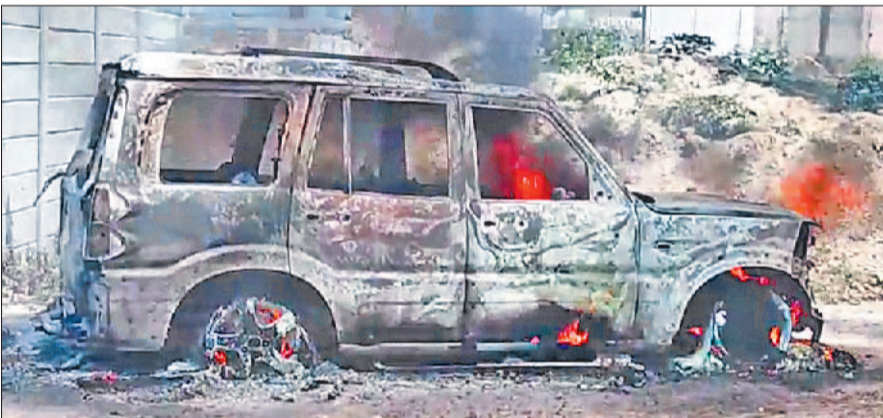
सोनीपत। सर्विस रोड पर आग लगने के बाद जलती स्कॉर्पियो।