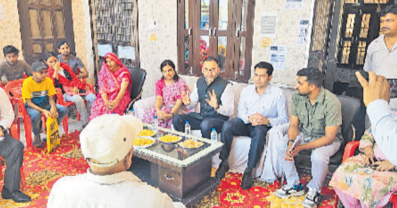
सोनीपत। निरीक्षण के दौरान टीम के सदस्य साथ में सीजेएम एवं अन्य।